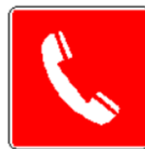
Telefono per interventi antincendio