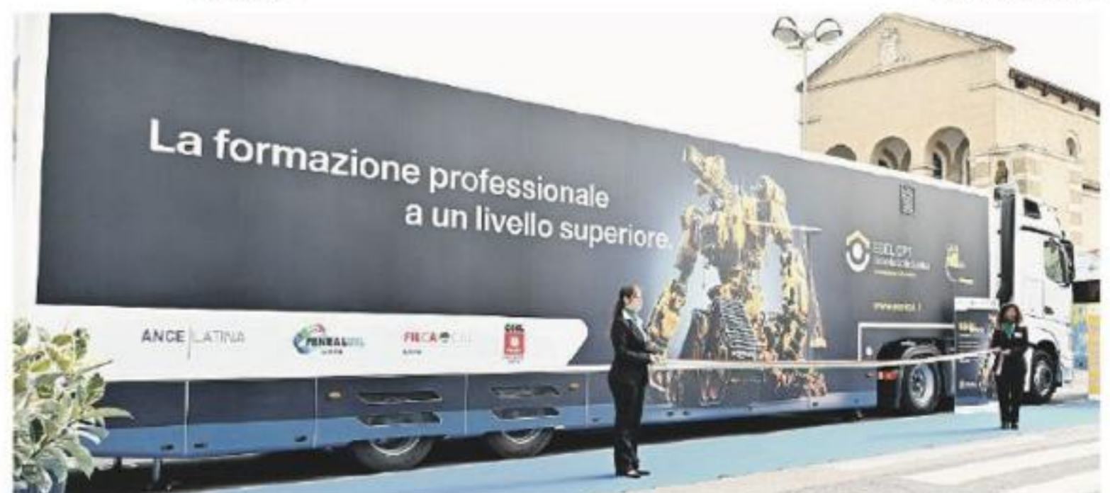
La nuova unità Esel Mobile