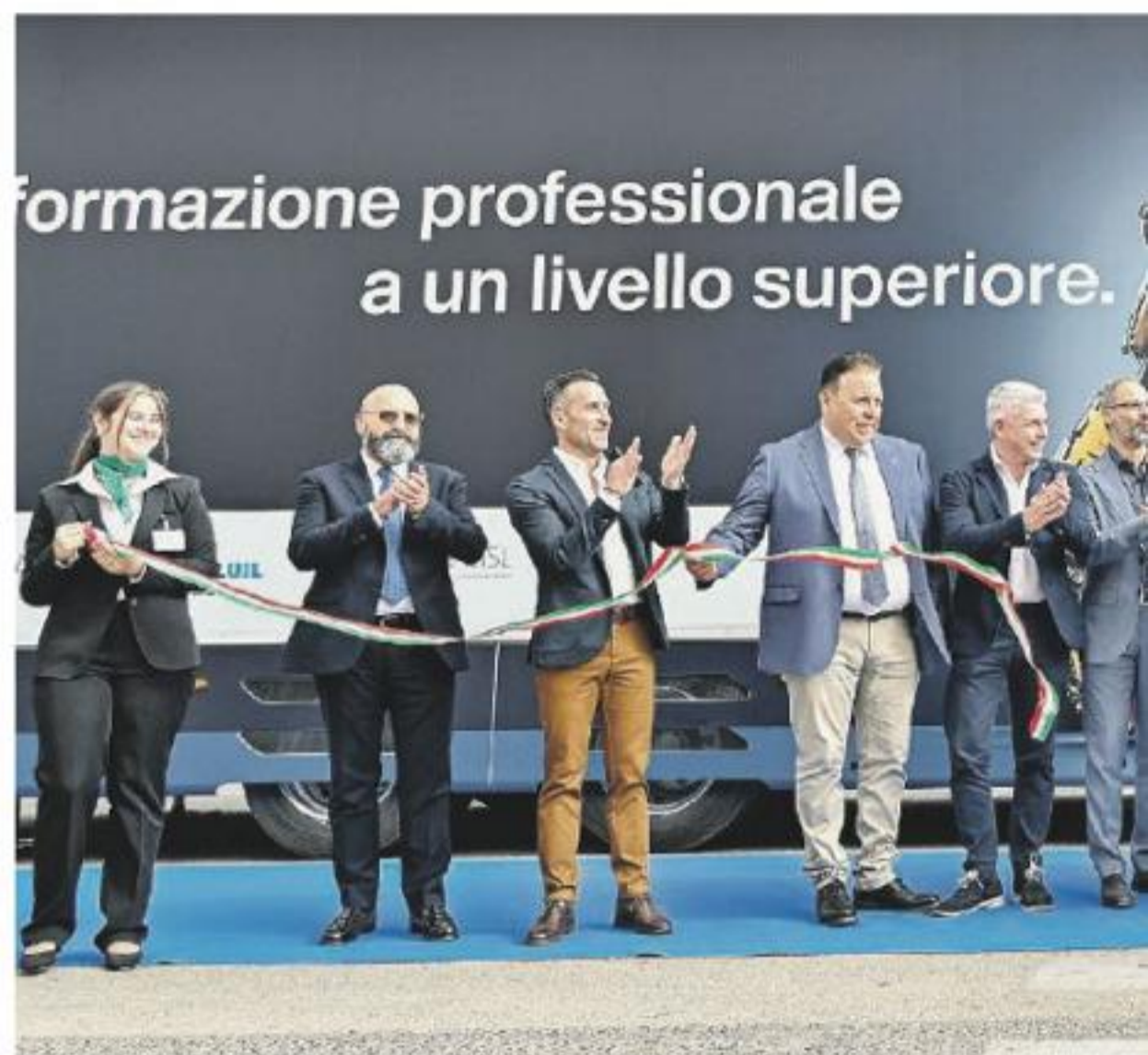
Alcuni momenti dell'inaugurazione dell'unità mobile di ieri pomeriggio

Nello specifico, l'aula mobile è progettata per ospitare diversi